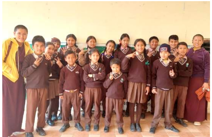
Les enfants sponsorisés ont le choix entre 2 écoles différentes (avec ou sans tibétain)