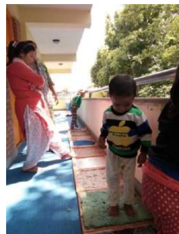
Chemin de stimulation sensorielle